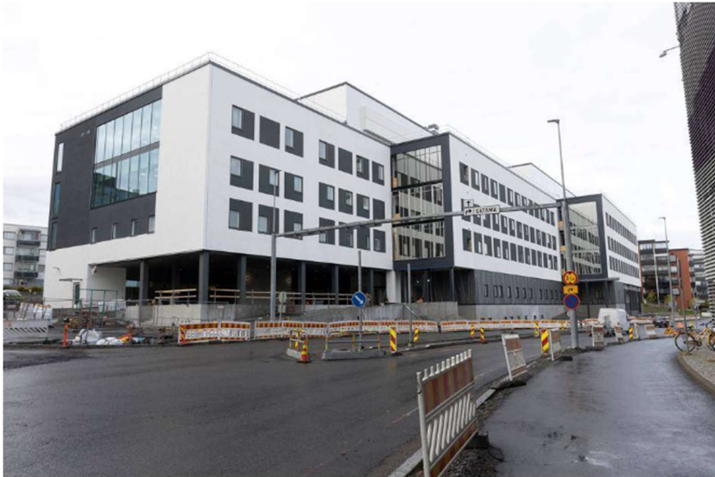
Mielen ja kuntoutuksen talon työmaa Mannerheimintien varrella alkaa olla ulkotöiden osalta valmiina. TARU HOKKANEN

Mielen ja kuntoutuksen taloon muuttavat kaikki Moision psykiatrisessa sairaalassa toimivat osastot, mielenterveys- ja päihdepalveluiden avopalvelut eri puolelta Mikkeliä, lastenpsykiatrian päiväosasto, lasten ja nuorten sairaalaopetus, neurologinen ja ortopedinen kuntoutusosasto sekä palliatiivinen keskus. Sairaalaopetus on Mikkelin kaupungin sivistystoimen alaista toimintaa, ja sivistystoimi tulee tiloihin vuokralle.